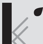
OLIE- OG VANDAFVISENDE